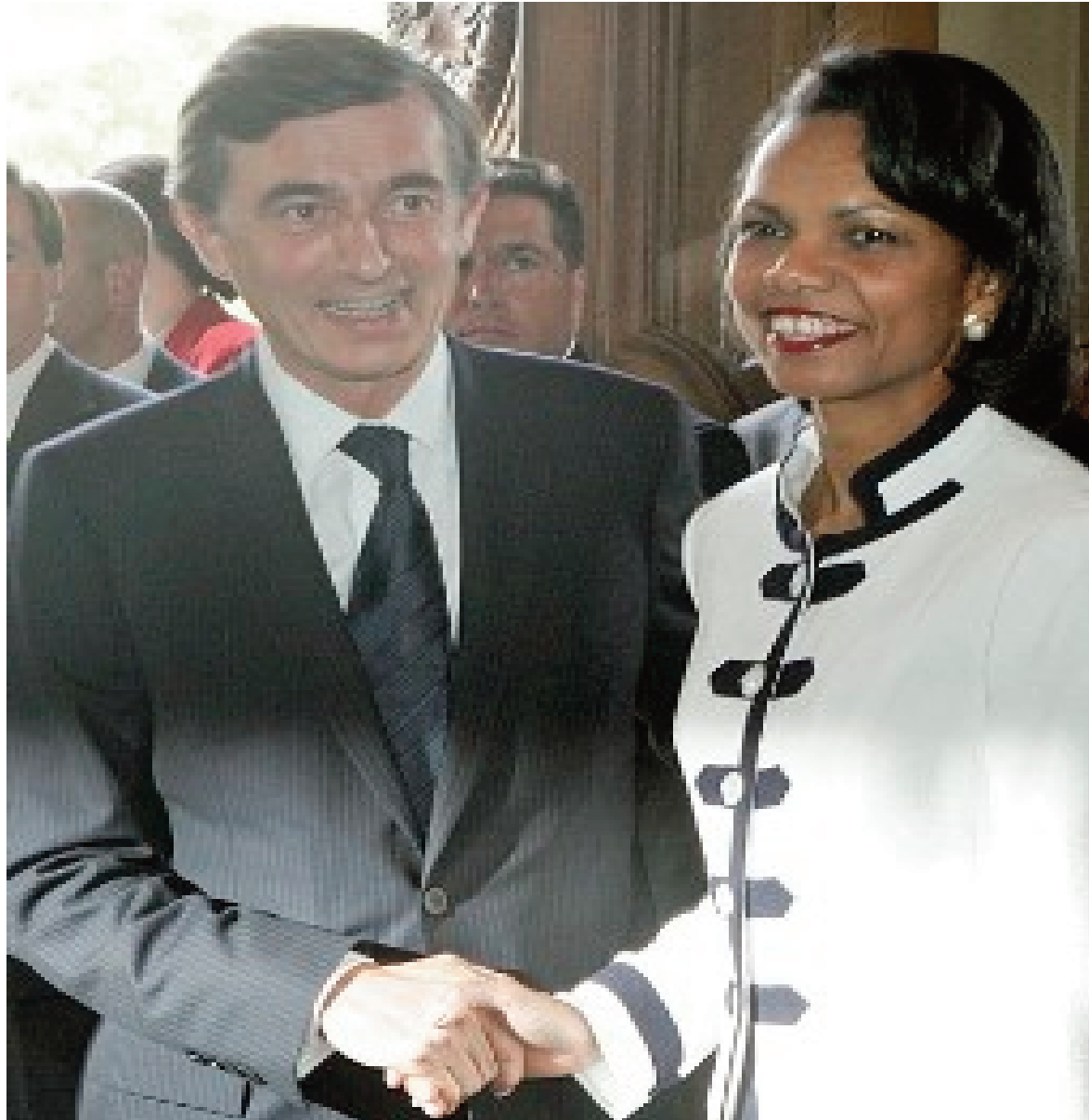
Condoleezza Rice-t, Bush külügyminiszterét bírálják a merész öltözködése miatt.